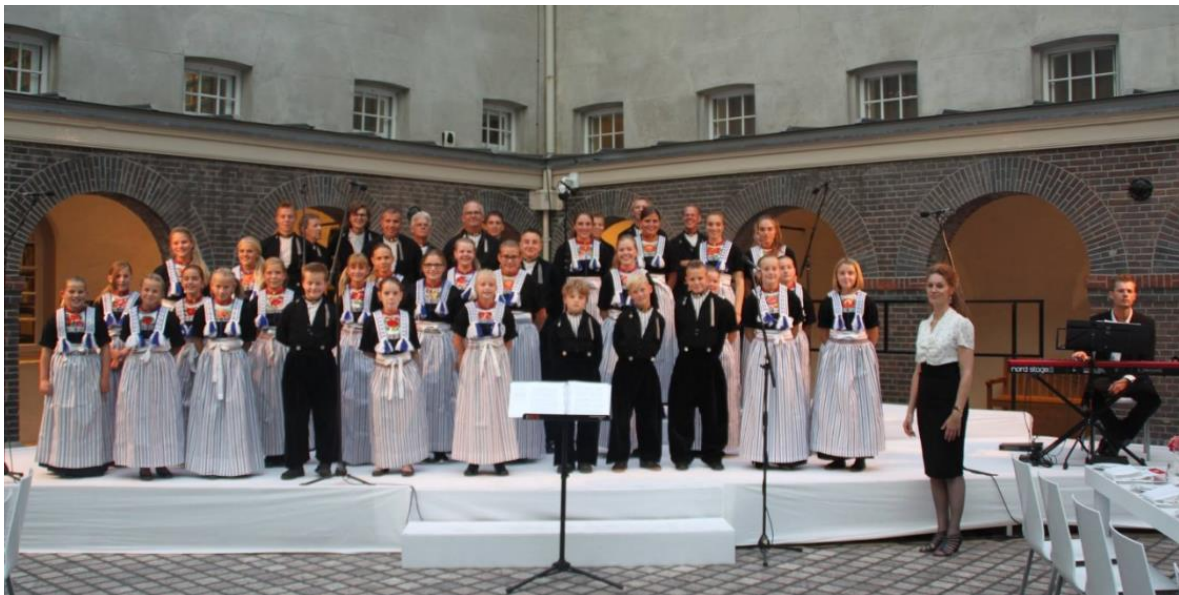
Optreden Scheepvaartmuseum tijdens Sail Amsterdam 2015