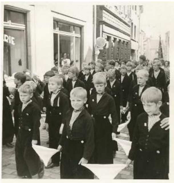
Pinksteren 1970 in Echternach, Luxemburg