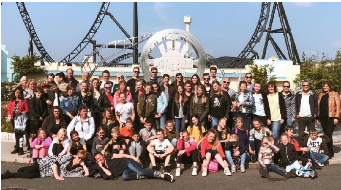
Koorreis naar Groesbeek 2019