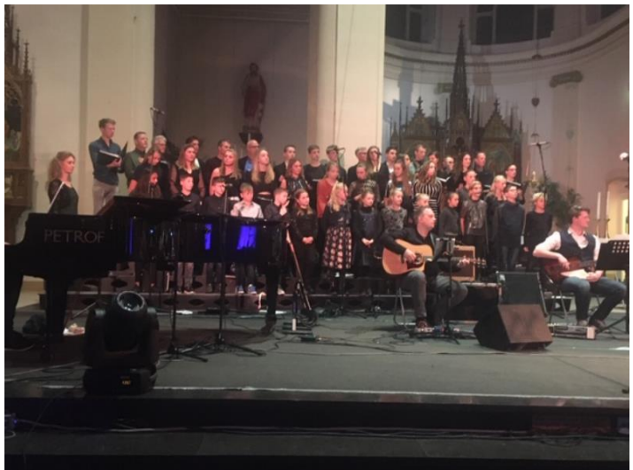
Populair Kerstconcert 2019