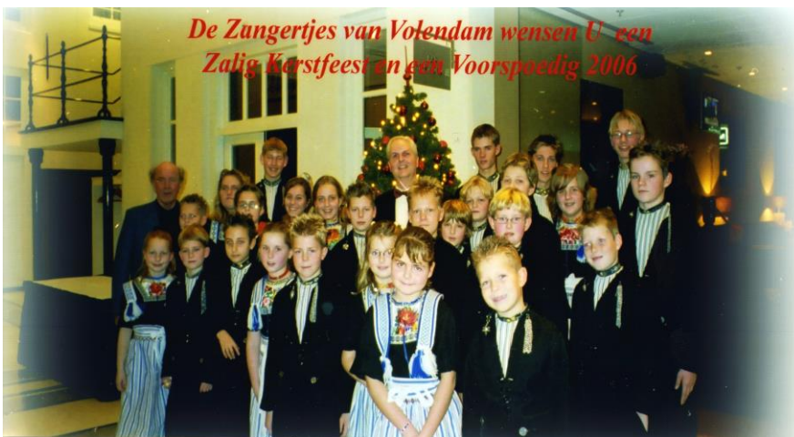
Wie herkent iemand of zichzelf op de kerstkaart van 10 jaar geleden?