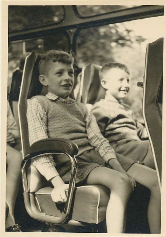
Augustus two 1960