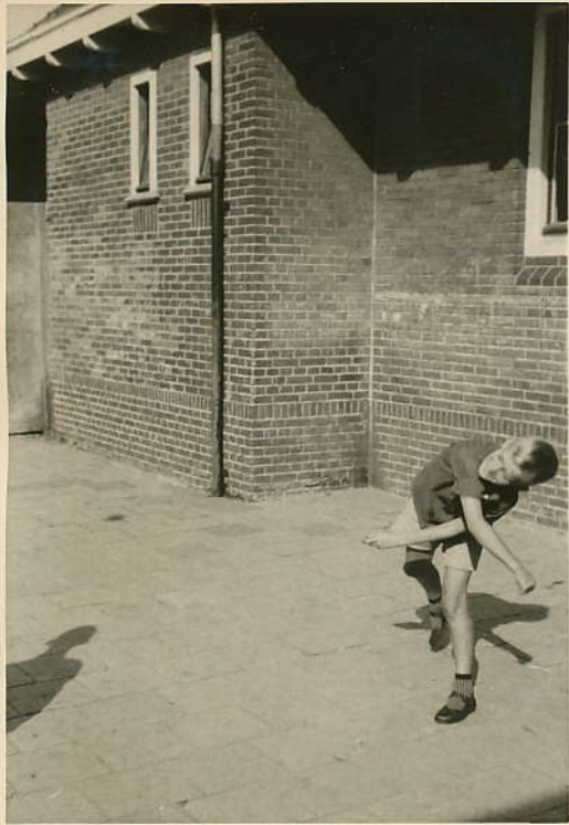
Sij men Mor.