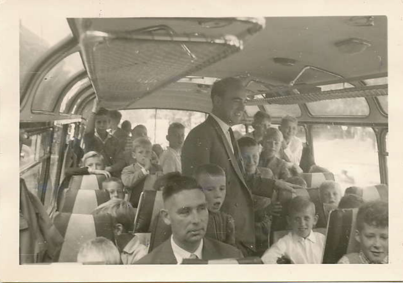
Medale bus van J. Roving