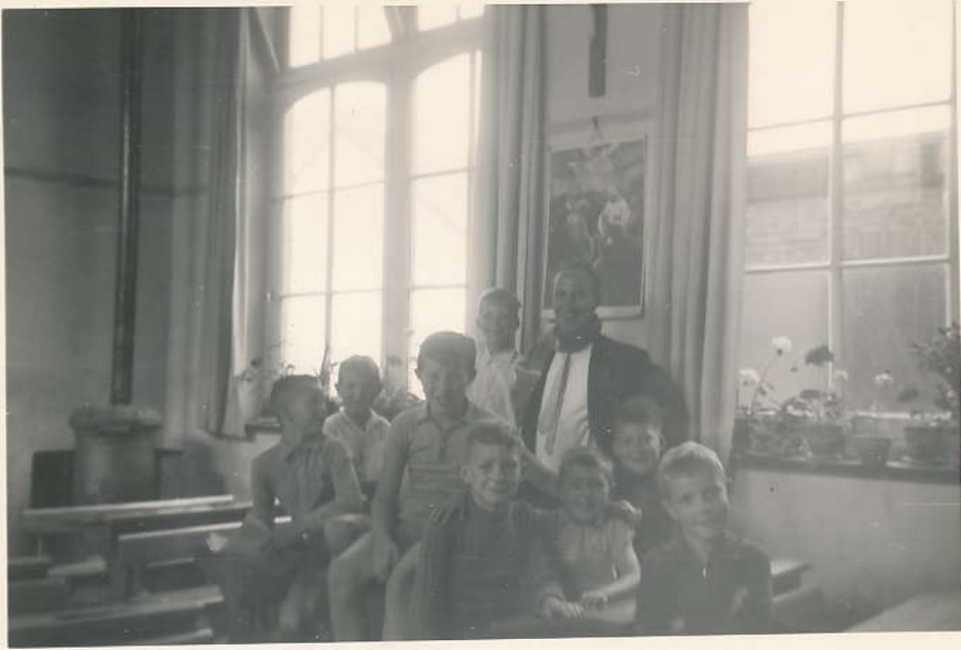
in de klas aan de Conynstraat