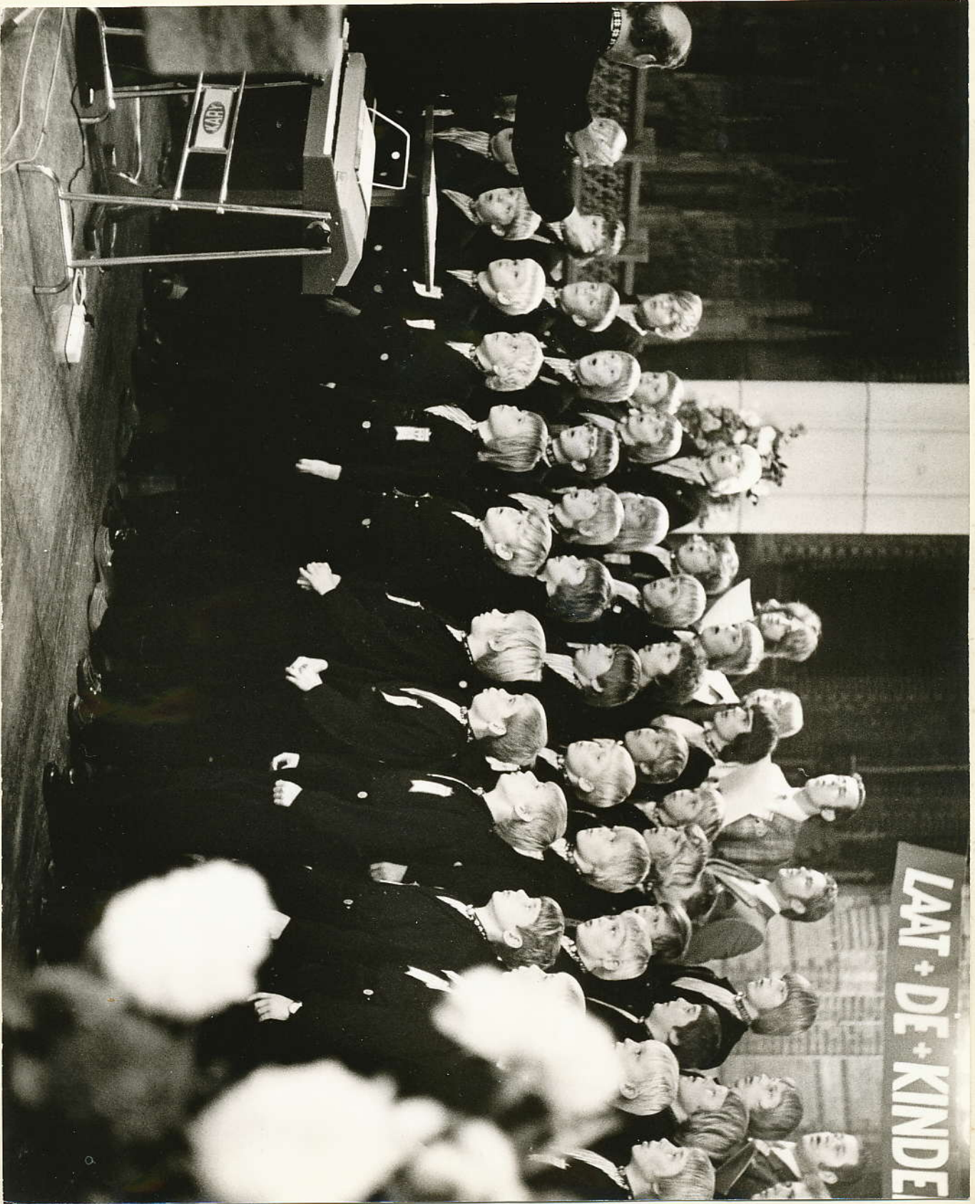
Ons eerste optreden in "Pueri Cantores" verband in de Vituskerk in Hilversum.