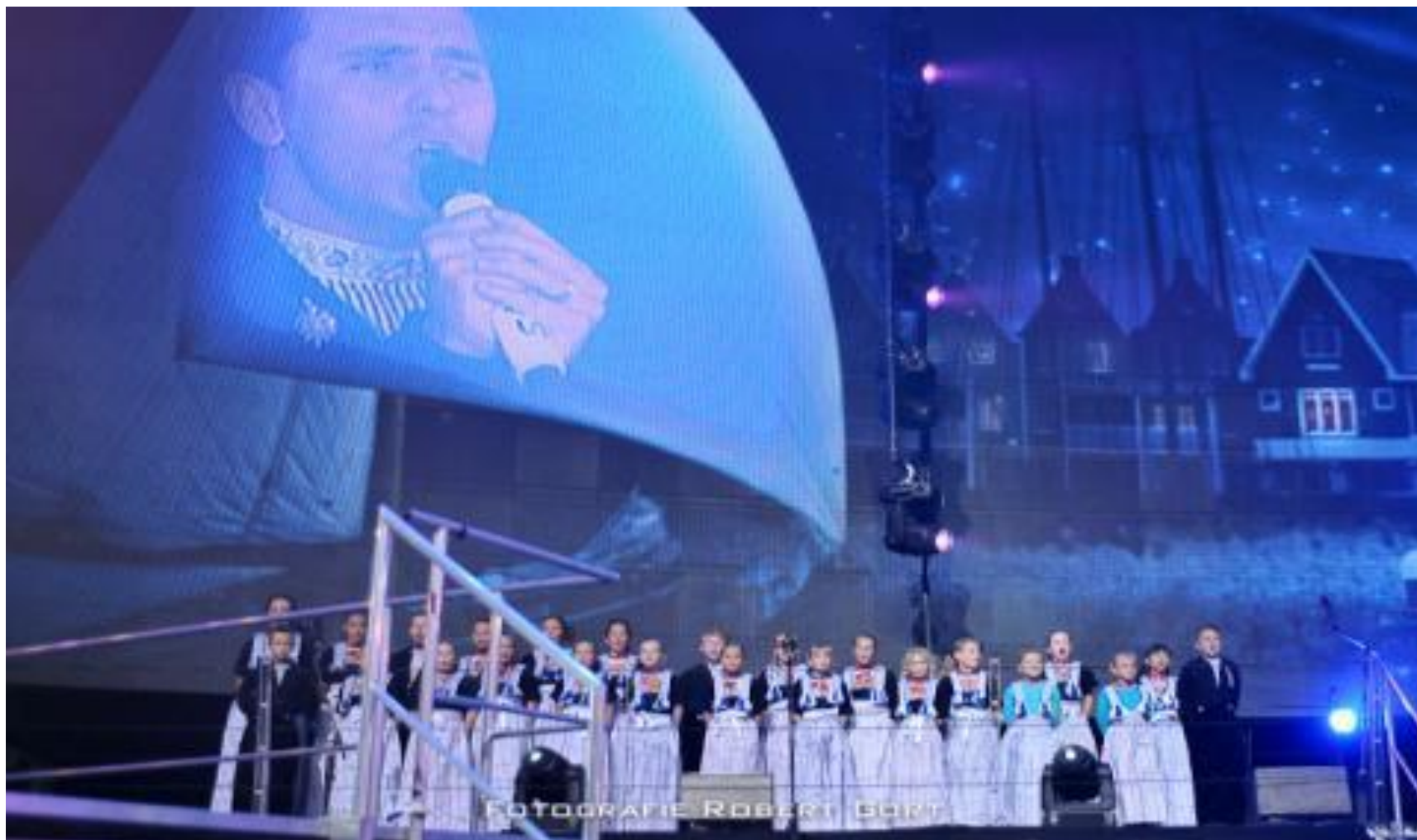
FOTOGRAFIE ROBERT BORT